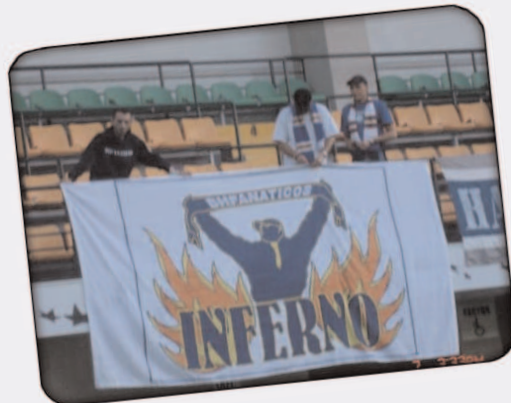
BHF on tour Moldavija

Jos jednom zelim u svoje ime i ime raje da se zahvalim svima na pomoci oko odlaska u Moldaviju, raji iz dijaspore za pare, Pretorianu za sredjene vize a ekipi iz Busa za nezaboravan provod i zajebanciju,ne bi vas ni za dukate mjenj'o.