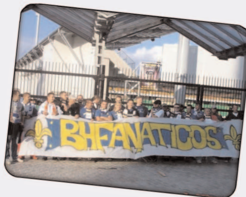
BHF on tour Moldavija