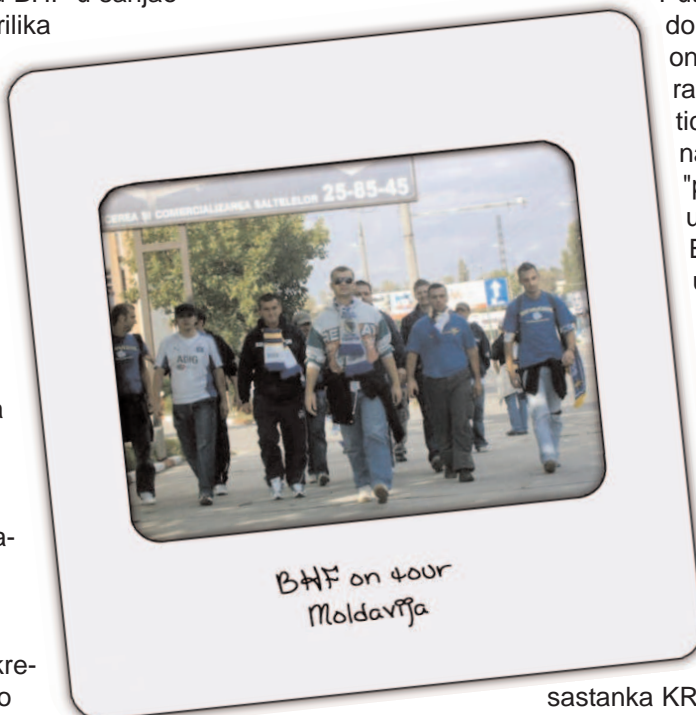
BHF on tour Moldavijska

Stizemo u Rumuniju.. oh ta prekrasna zemlja koja nas je sve mogla kostati boravka na odjelu psihijatrijske bolnice Kosevo u daljem tekstu cete vidjet zasto.