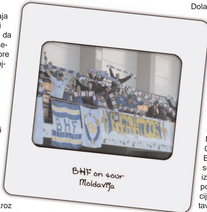
BHF on tour Moldavijska

sastanka KRIZNOG STABA i prijetnje da cemo Monstrumu i Ubici prvo oduzeti kartu pa volan pa na kraju i zivote, nastavljamo put Moldavijske.